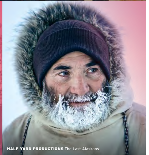
HALF YARD PRODUCTIONS The Last Alaskans