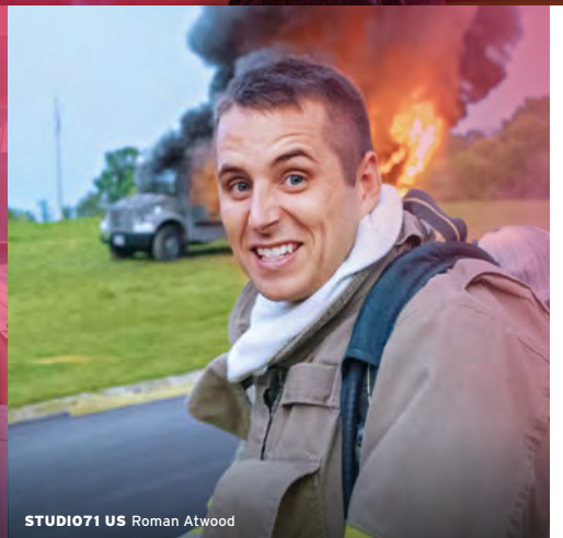
STUDIO71 US Roman Atwood