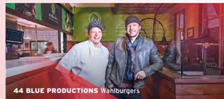
44 BLUE PRODUCTIONS Wahlburgers

*2005 gegründet, seit 2012 Teil der Red Arrow-Gruppe