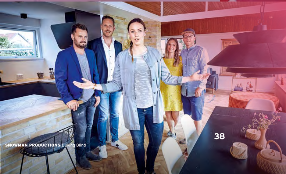
SNOWMAN PRODUCTIONS Buying Blind