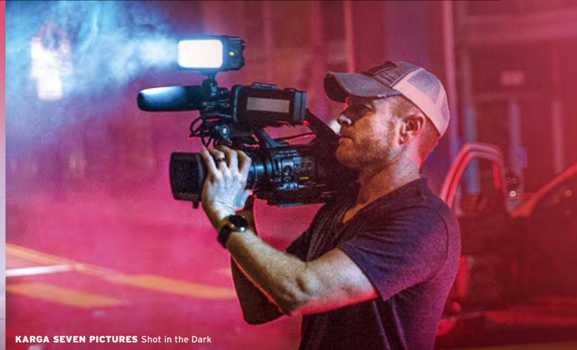
KARGA SEVEN PICTURES Shot in the Dark