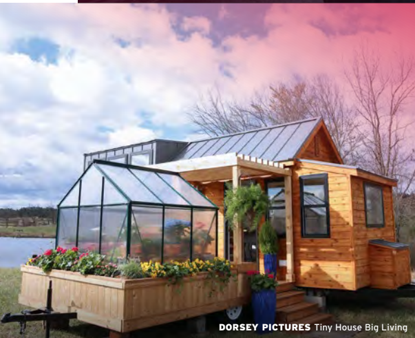
DORSEY PICTURES Tiny House Big Living