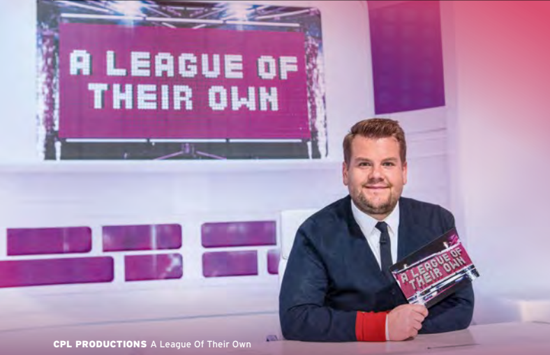
CPL PRODUCTIONS A League Of Their Own