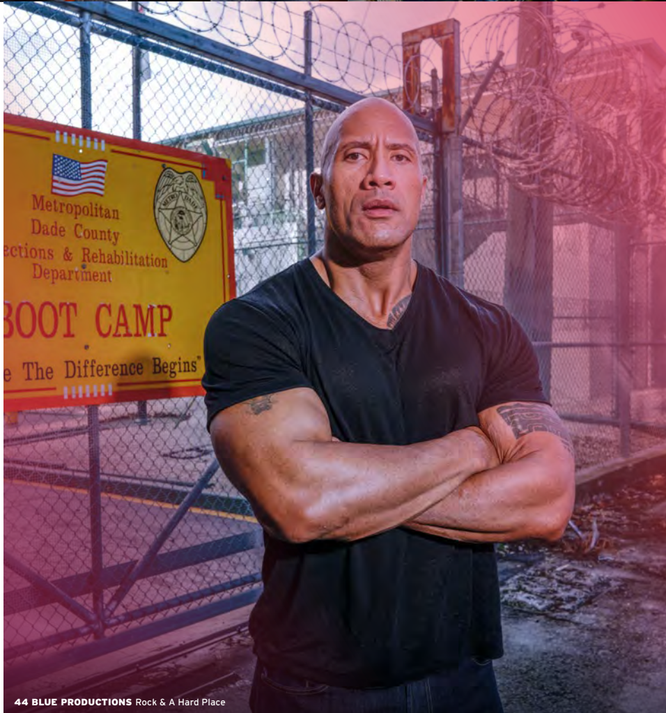
44 BLUE PRODUCTIONS Rock & A Hard Place