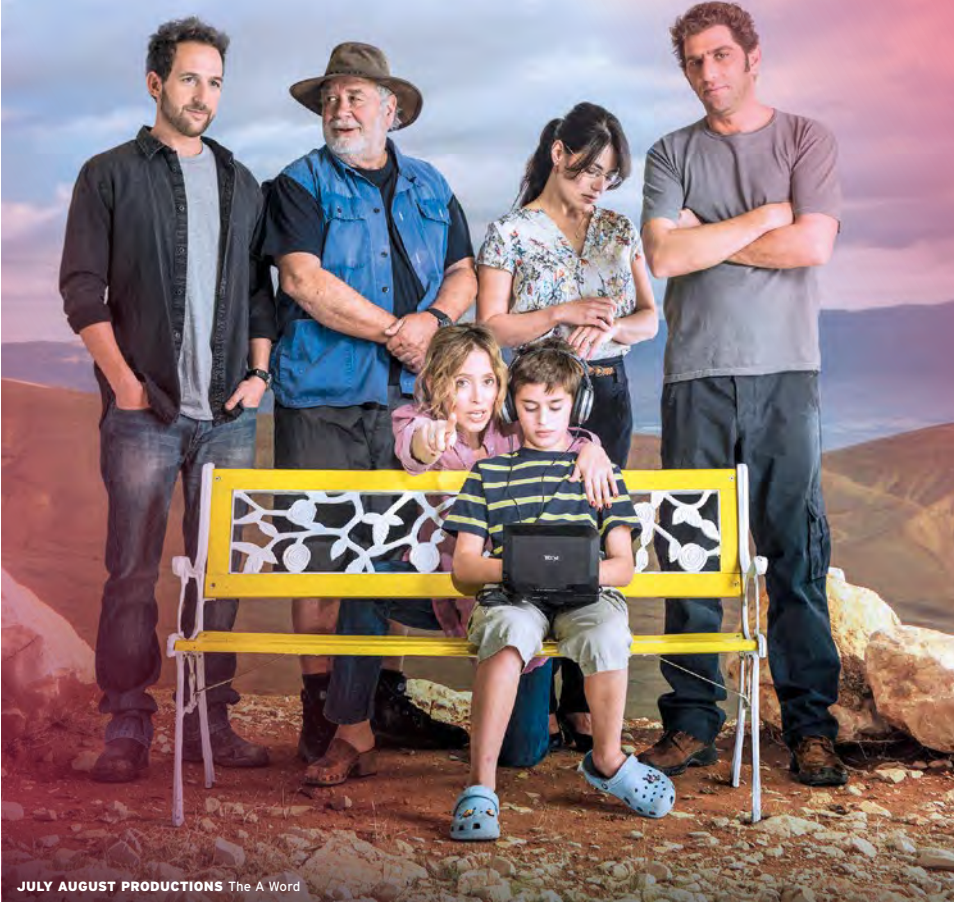
JULY AUGUST PRODUCTIONS The A Word