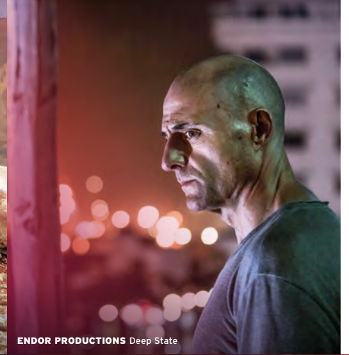
ENDOR PRODUCTIONS Deep State