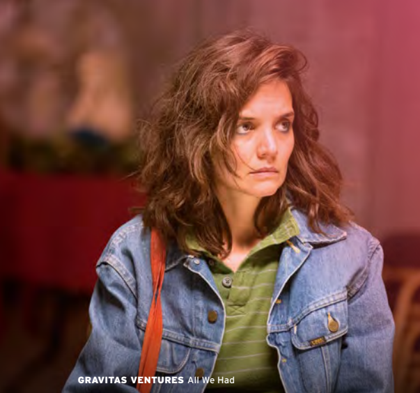
GRAVITAS VENTURES All We Had